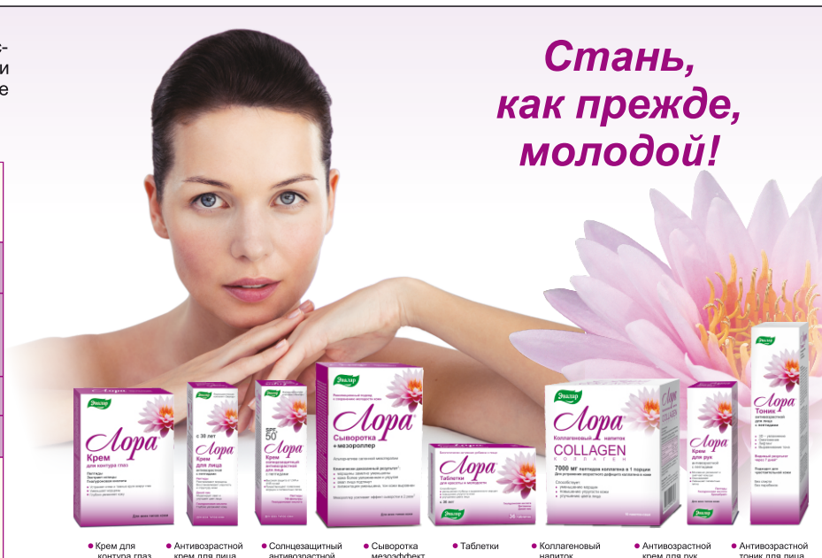
• Крем для контура глаз • Антивозрастной крем для лица • Солнцезащитный антивозрастной крем для лица • Сыворотка мезозффект • Таблетки • Коллагеновый напиток • Антивозрастной крем для рук • Антивозрастной тоник для лица

* БАД. НЕ ЯВЛЯЕТСЯ ЛЕКАРСТВЕННЫМ СРЕДСТВОМ